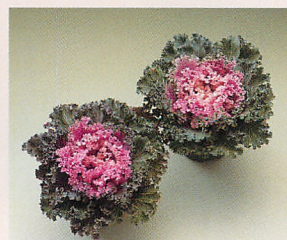
ポット仕立て (桃かもめ)