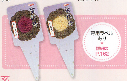
F 1 白すずめ