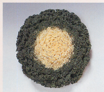
F 1 白かもめ