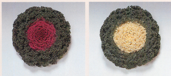
F 1 紅すずめ