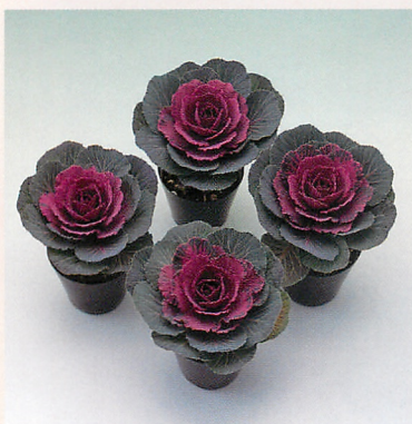
ポット仕立て (冬紅)