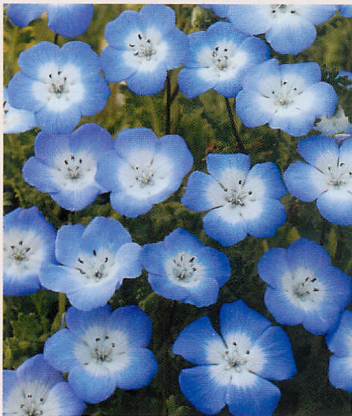
インシグニス ブルー

発芽適温 15~20℃ | 発芽日数 10日(光) 生育温度 5~20℃ | 播種量/1a 10ml