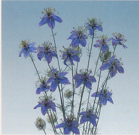
ブルー イスタンブール

発芽適温 20℃ | 発芽日数 15日 生育温度 5~25℃ | 播種量/1a 30~40ml