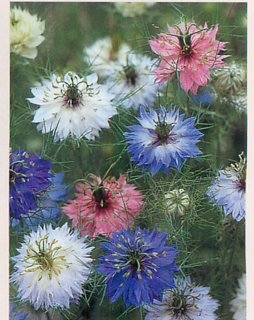
ベルシャン ジュエル