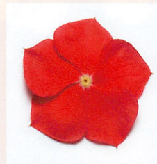
1 パシフィカXP リアリーレッド