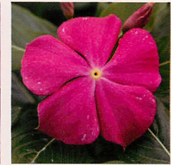
12 F1タイタン ローズ