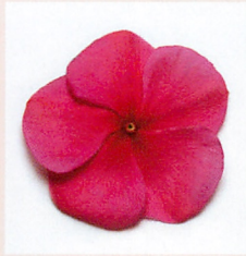
2 F1タイタン バーガンディーインブ