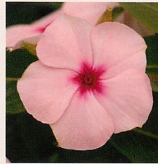
4 F1タイタン アプリコット