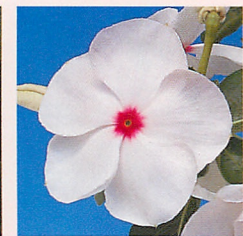
3 パシフィカXP ボルカドット