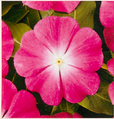
1 F1タイタン ローズハロー

F1でシリーズ揃いがよく、分枝性に優れ大きな花弁が特長。従来種と比べ高温乾燥、低温など厳しい条件下でも強い性質。12色。