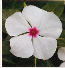
9 F1タイタン ボルカドット