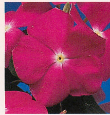
4 パシフィカXP ディープオーキッド