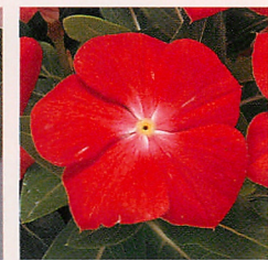
6 パシフィカXP コーラル