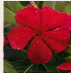
5 F1タイタン ダークレッド