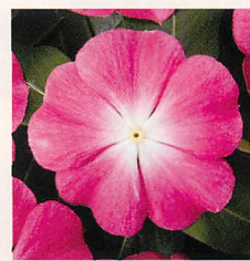
7 パシフィカXP ローズハロー