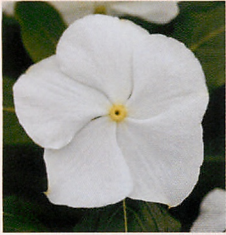
7 F1タイタン ピュアホワイト