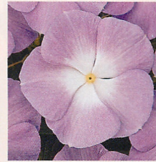
11 F1タイタン ラベンダーブルーハロー