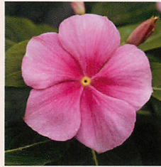
3 F1タイタン アイシーピンク