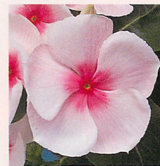
2 パシフィカXP ブラッシュ