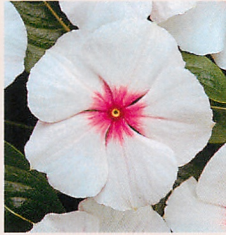
8 F1タイタン ブラッシュ