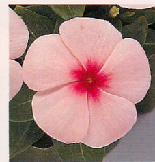
5 パシフィカXP アプリコット