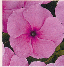
10 F1タイタン ライラック