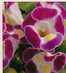
2 F1カウアイ バーガンディー