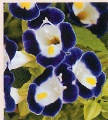
1 F1カウアイ ブルー&ホワイト