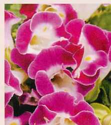
5 F1カウアイ マゼンタ