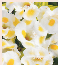
4 F1カウアイ レモンドロップ