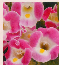
6 F1カウアイ ローズ