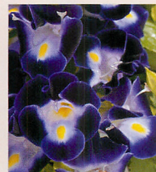
3 F1カウアイ ディープブルー