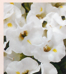
7 F1カウアイ ホワイト