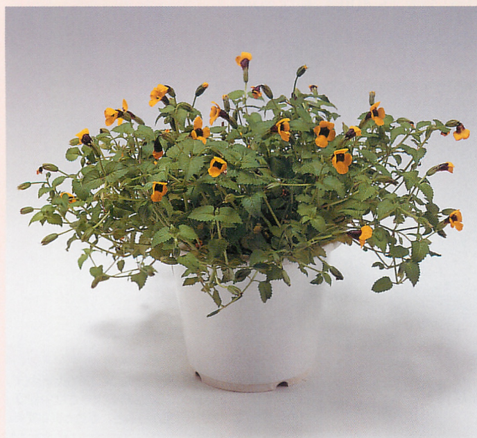
パイロニー(スージーウォン)