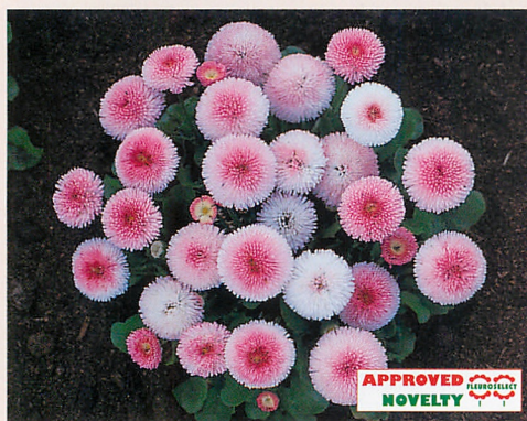
タッソー ストロベリー&クリーム