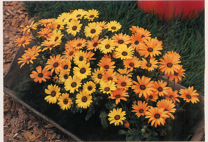
スプリングフラッシュ イエロー・オレンジ