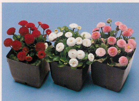
ボンボネット 混合