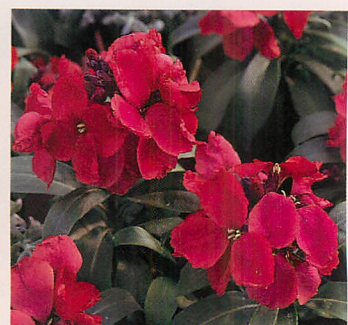
ベガ ローズレッド