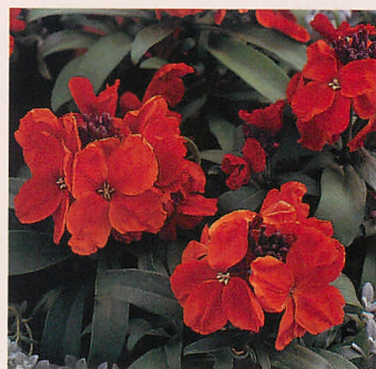
ベガ スカーレット