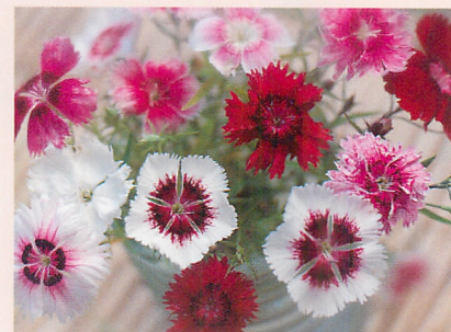
高性石竹 ヘッデウイギ 大輪一重咲き 混合