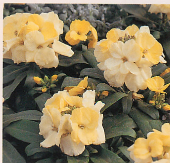
ベガ クリームイエロー