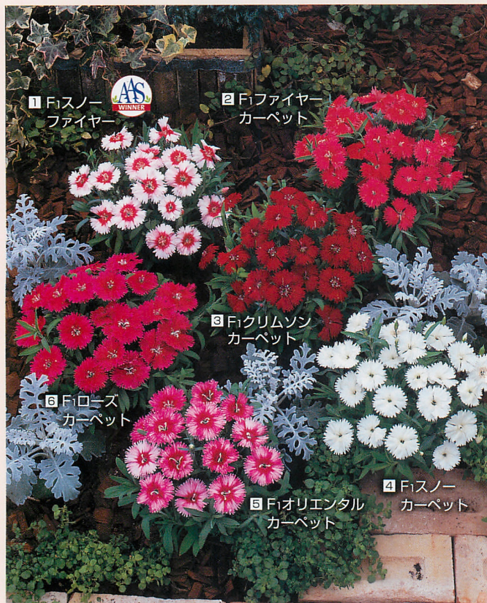
1 F1スノーファイヤー