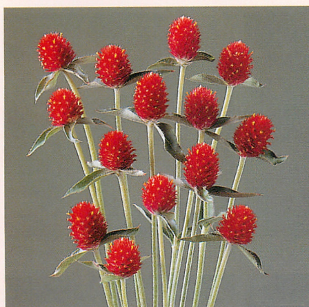
ストロベリー フィールズ