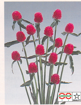
クイズカーマイン