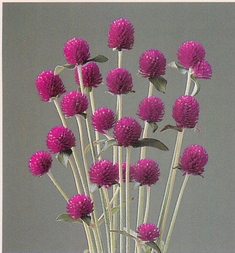
オードリー パープルレッド

1ケース 35,000円 (税込37,800円) 288穴×4トレイ(1,000本保証) 納期:4~6月 ご注文締切:希望納期の45日前