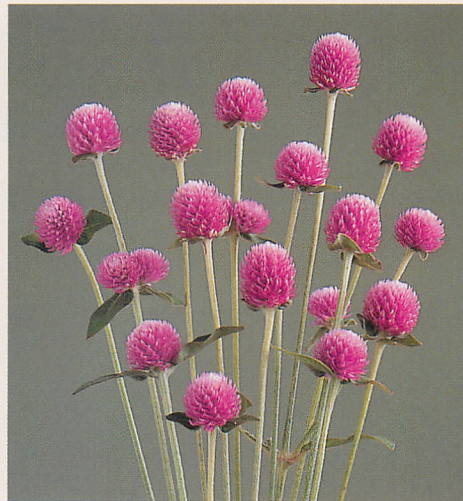
オードリー ピンクインブ