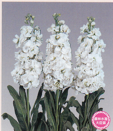
5 ホワイト ワンダー-2号