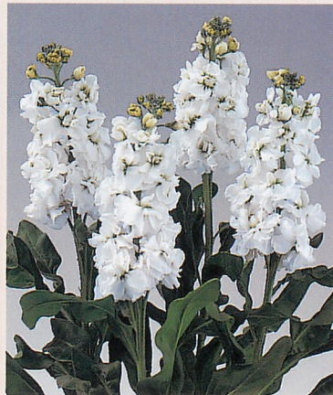
3 ジュノン ホワイト