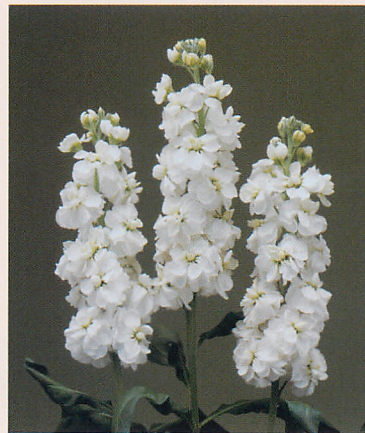
1 クルーズ ホワイト