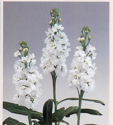
4 スノー ワンダー