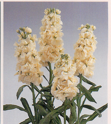
2 ハロウィン イエロー