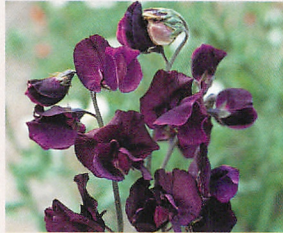
4 ロイヤル ネイビーブルー