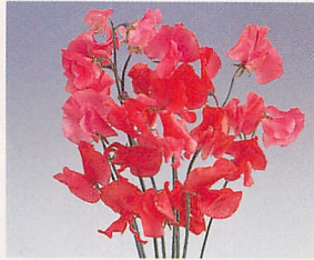
1 ロイヤル スカーレット