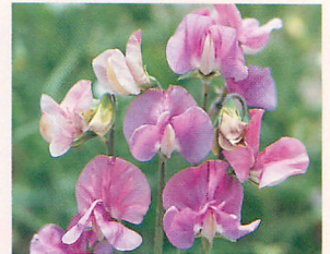
6 ロイヤル ブルー