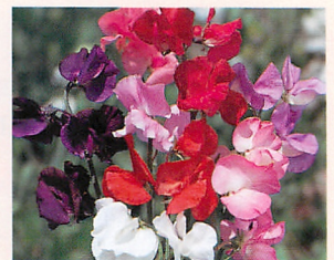
9 ロイヤル 混合