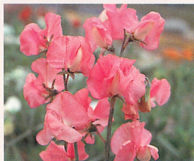
7 ロイヤル サーモン