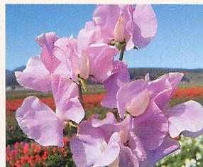
8 ロイヤル ラベンダー