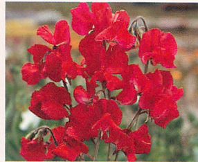
2 ロイヤル クリムソン