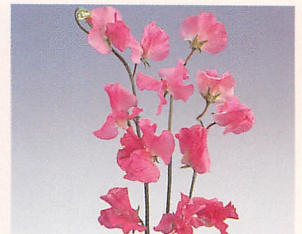
3 ロイヤル ローズピンク