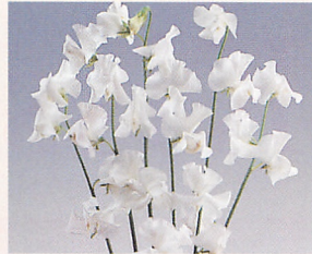
5 ロイヤル ホワイト