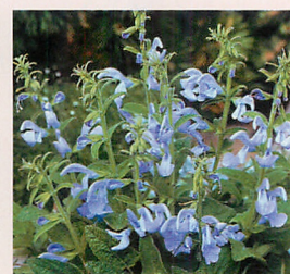
パティオ スカイブルー