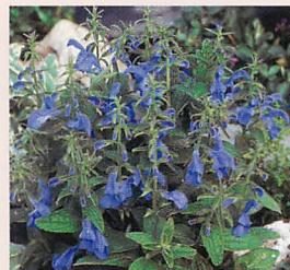
パティオ ディープブルー