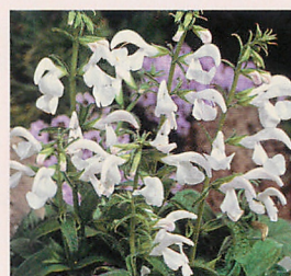
パティオ ホワイト