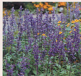
ビクトリア ブルー