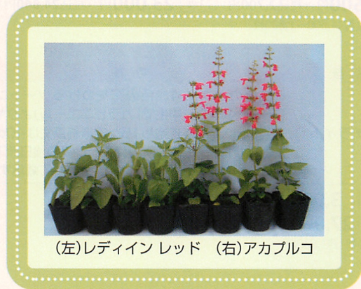
(左)レディインレッド (右)アカブルコ

価格 1ml 2,000円 (税込2,160円) (10ml種子粒数:約4,000~5,000粒)