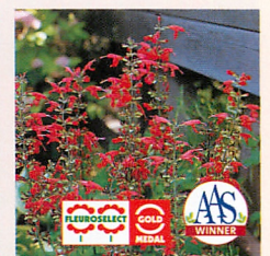
レディインレッド