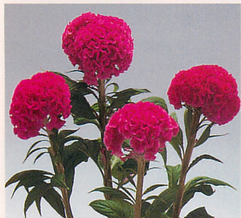
3 久留米 有明(青茎)