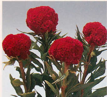
1 久留米 緋紅色2号(青茎)