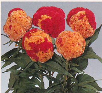
4 久留米 コロナ