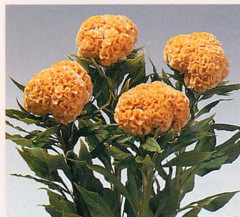
5 久留米 ゴールド