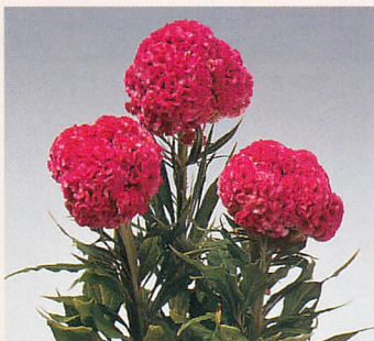
6 久留米 ローズ