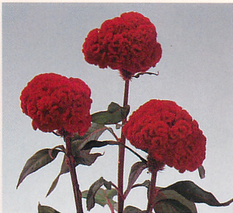
2 久留米 紅貴(赤茎)