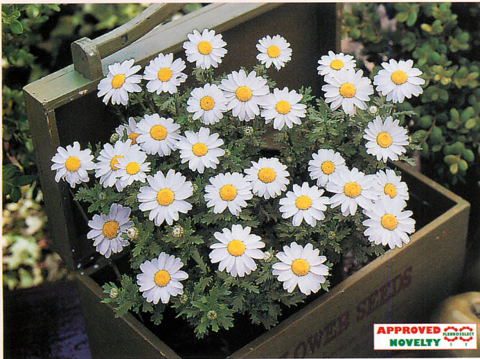
パルドサム スノーランド