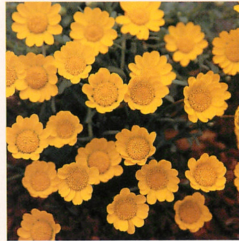
マルチコーレ イエロー