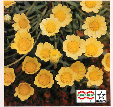
マルチコーレ ムーンライト