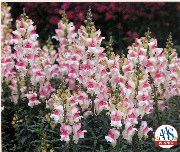
F 1 プリンセス パープルアイ