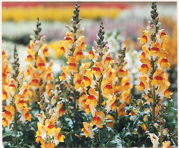
F 1 プリンセス レッドアイ