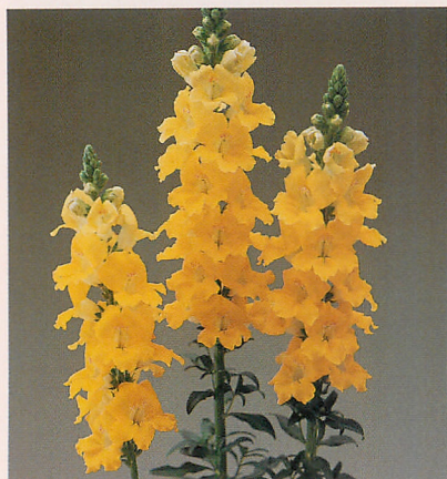
1 F1カリヨン イエローインプ