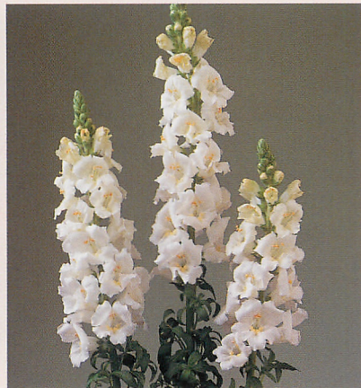
3 F1カリヨン ホワイトインプ