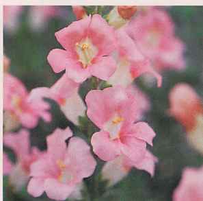
9 F1カリヨン ライトピンク