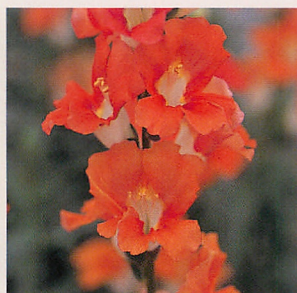
7 F1カリヨン サーモン