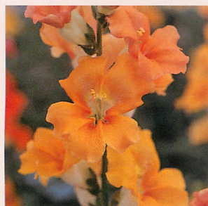
8 F1カリヨン アプリコット