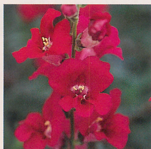
10 F1カリヨン パープル