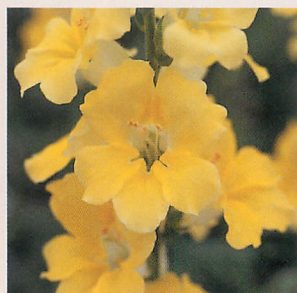
6 F1カリヨン クリームイエロー