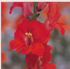
5 F1カリヨン アンティーク