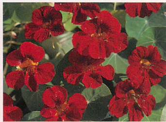
❷ チップトップ マホガニー