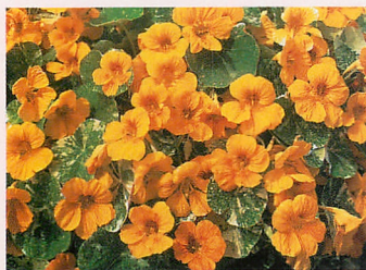
❺ チップトップ アラスカゴールド(斑入り葉)