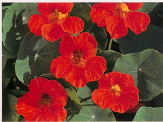
❶ チップトップ スカーレット

発芽適温 15~20℃ | 発芽日数 7~14日 生育温度 15~25℃ | 播種量/1a 400~500ml