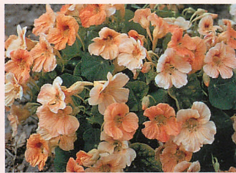
❹ チップトップ アプリコット