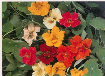
❼ ジュエル 混合