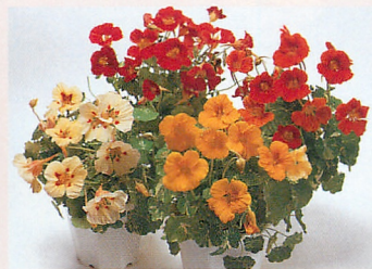
❻ アラスカ 混合