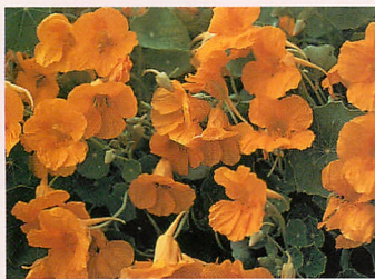
❸ チップトップ ゴールド