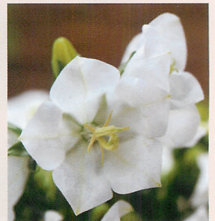
F1タキオン ホワイト