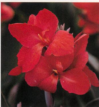
2 トロピカル ブロンズスカーレット