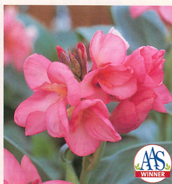
4 トロピカル ローズ