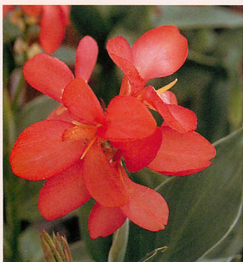
1 トロピカル コーラル