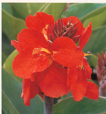
3 トロピカル レッド