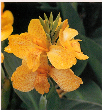
5 トロピカル イエロー