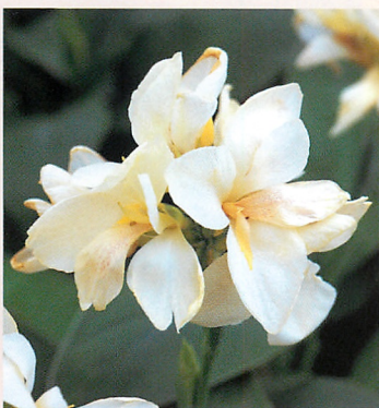
6 トロピカル ホワイト