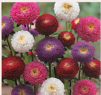
ちくまボンボン 混合