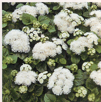
F 1 アロハ ホワイト