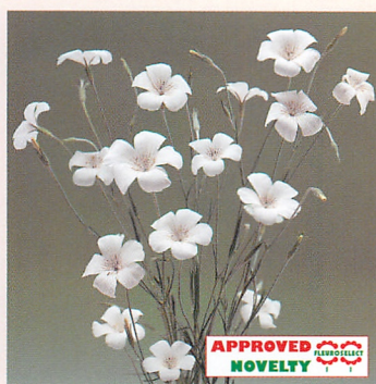
オーシャンパール