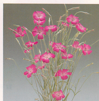
パープルクイーン