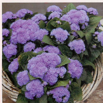
F 1 アロハ ブルー

発芽適温 20~25℃ | 発芽日数 5~8日(光) 生育温度 15~25℃ | 播種量/1a 10mℓ