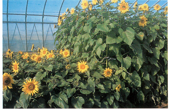
弊社「緑肥用ひまわり」との比較 左：キッズスマイル 右：緑肥用ひまわり