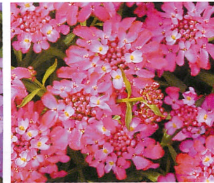
キャンディーケーン レッド

目次 新品種紹介 種子 草花 お勧めの商品 ユーストマ お勧めの商品 ビオラ お勧めの商品 パンジー ア カ サ タ ナ ハ マ ヤ ラ ワ M 野菜系 野菜種子 球根&鉢物 資材 印刷