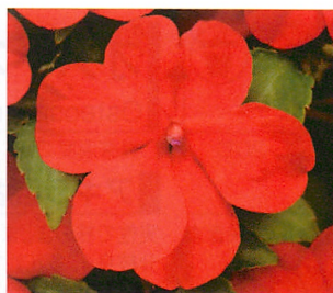
インプレザ レッド