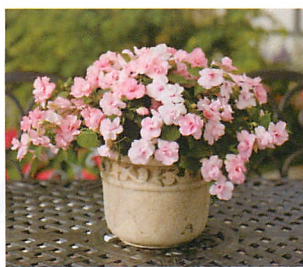
アテネ アップルブロッサム