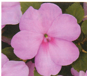
インプレザ ブルーパール