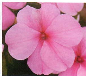
インプレザ ピンク