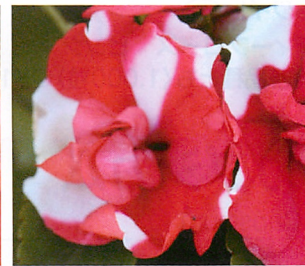
アテネ レッドフラッシュ