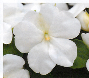
インプレザ ホワイト