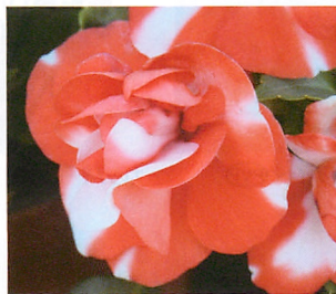
アテネ オレンジフラッシュ