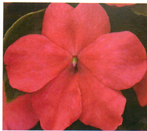
インプレザ パンチ