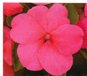
インプレザ ローズ