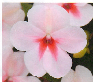
インプレザ チェリースプラッシュ