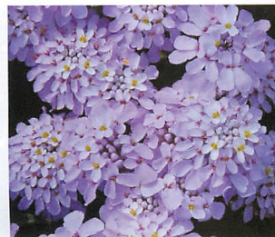
キャンディーケーン ライラック