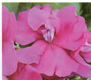
アテネ ブライトパープル