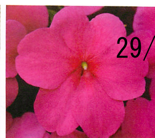
インプレザ バイオレット