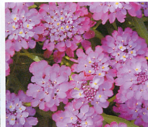
キャンディーケーン パープル